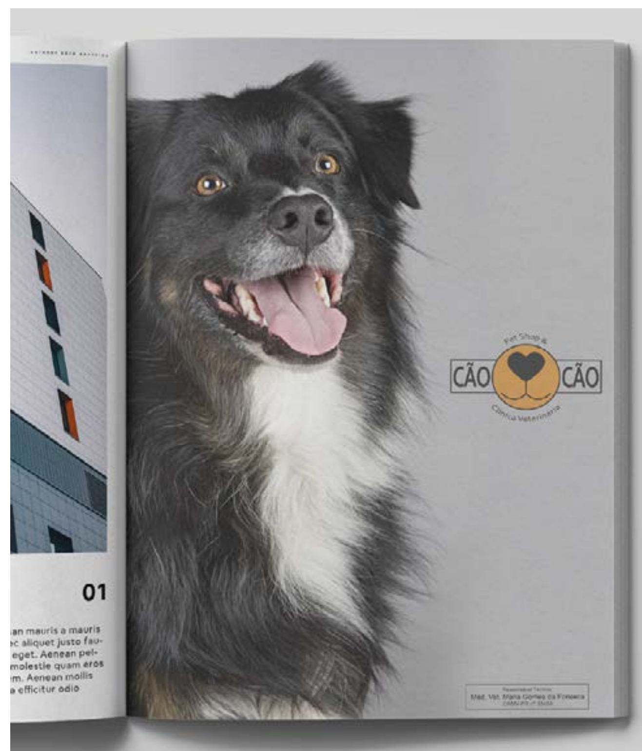
a. Anúncio para jornais e revistas.