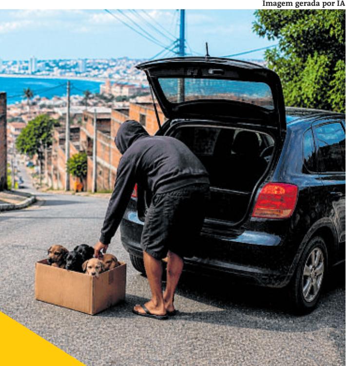
Imagem gerada por IA

Imagem gerada por IA mostra situação comum de abandono